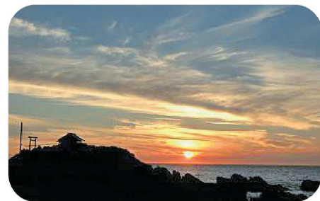
太櫓海岸 弁天岬(せたな町)