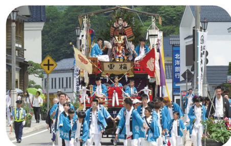
江差姥神大神宮渡御祭(江差町)