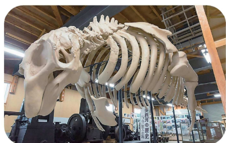
ピリカカイギウ(今金町)