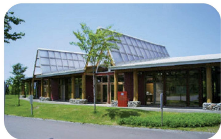
鶉ダムオートキャンプ場「ハチャムの森」(厚沢部町)