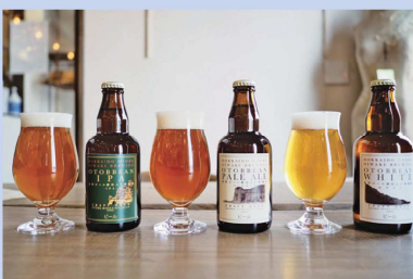
クラフトビール 「OTOBBean(オトビアン)」

檜山地方の中部に位置しており、一面に広がる日本海と乙部岳に囲まれた自然豊かな町です。異国情緒あふれる白亜の断崖「シラフラ」や「東洋のグランドキャニオン」と呼ばれる「館の岬」のほか、柱状節理による独特の岩肌で北海道天然記念物にも指定されている「鮪の岬」、2本の枝が1本につながっており「縁結びの神様が宿る」と伝えられている連理の木「縁桂」など雄大な自然に育まれた観光名所が数多くあります。