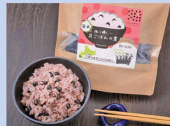
黒千石大豆 ごはんの素