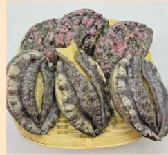
養殖活蝦夷あわび