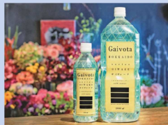
ミネラルウォーター 「Gaiyota(ガイヴォータ)」