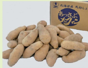
あっさふメークイン