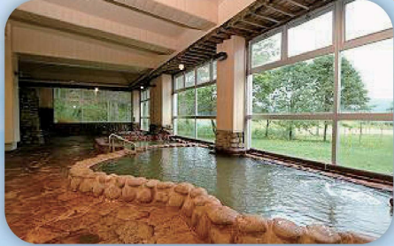
上ノ国町国民温泉保養センター(上ノ国町)