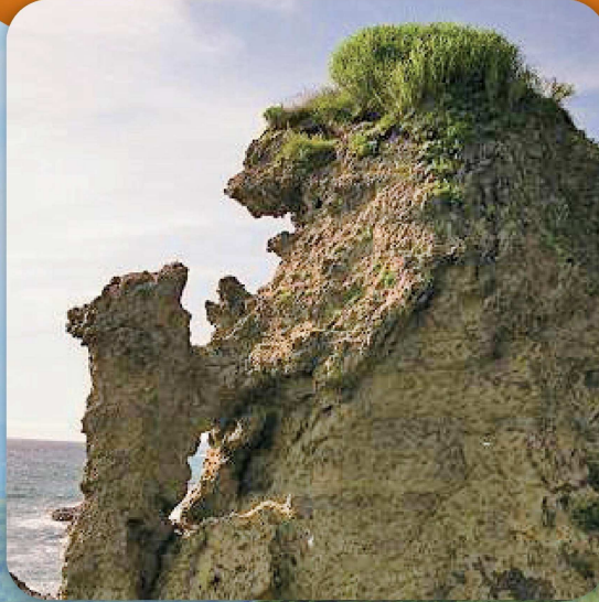
親子熊岩(せたな町)