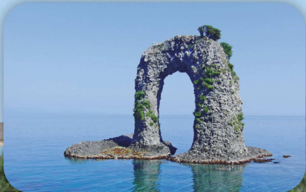
なべつる岩(奥尻町)