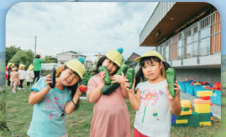
認定こども園「はせる」(厚沢部町)