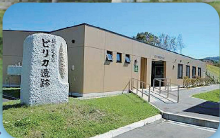
ピリカ遺跡ピリカ旧石器文化館(今金町)