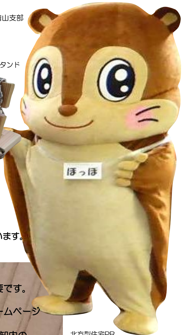
北方型住宅PR マスコットキャラクター「ほっほ」