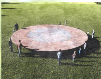
4 Plate (of 100 meters arc)