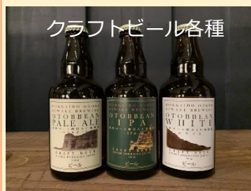
クラフトビール各種

○乙部の天然水を使用した人気のクラフトビールを販売。注ぎたてのビールが味わえます！