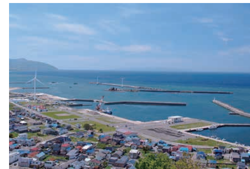
せたな町 立象山展望台からの景色