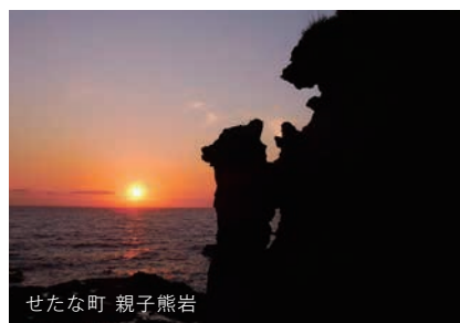
せたな町 親子熊岩