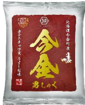
今金男しゃくと「ポテトチップス今金男しゃく」