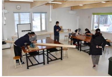
「上ノ国町地域活動支援センター」

さらに、18歳以下の子どもの医療費・保育料・小中学校の給食費などの無料化や、子供が新しく生まれた世帯への出生祝い金の給付など、子育て世代を手厚く支援しています。