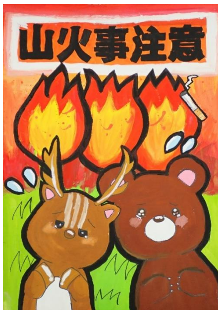
最優秀賞 上家 千尋