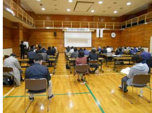
セミナー・情報交換会