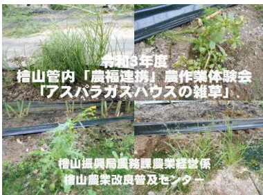
ハウスアスパラガスの雑草