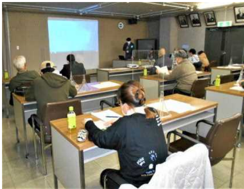
活動報告（JAアスパラ組合）