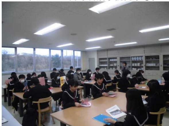
(道立江差高等看護学院見学①)