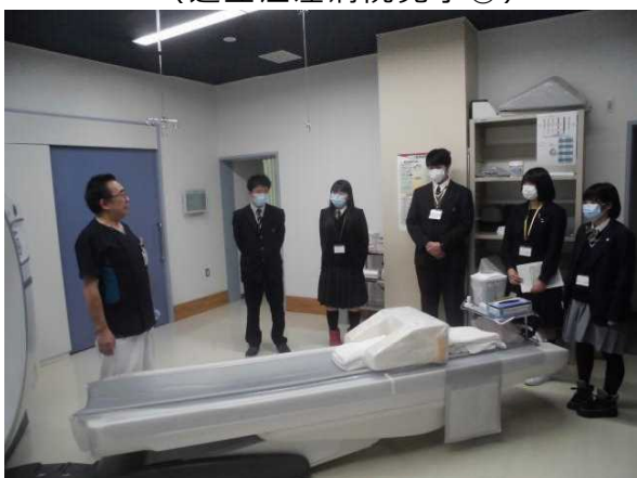
(道立江差病院見学⑤)