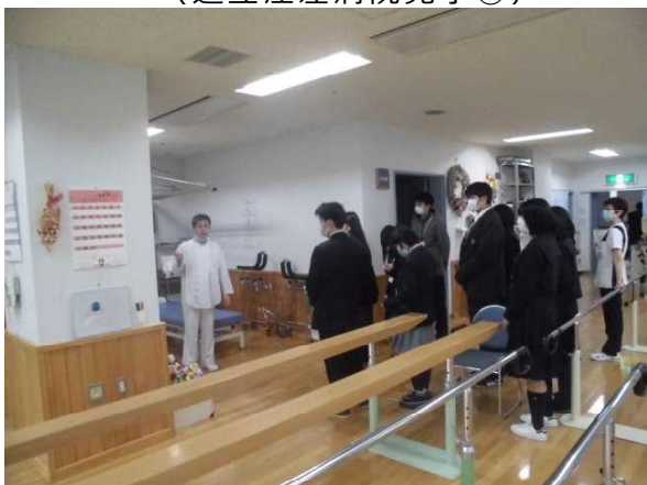
(道立江差病院見学③)