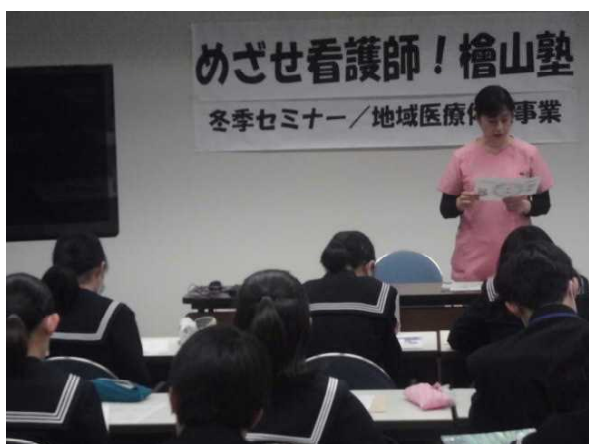
(道立江差病院見学①)