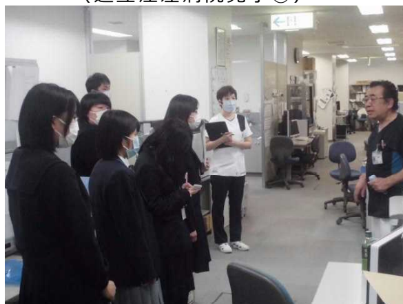
(道立江差病院見学④)