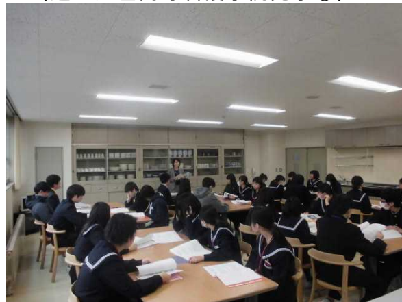
(道立江差高等看護学院見学②)