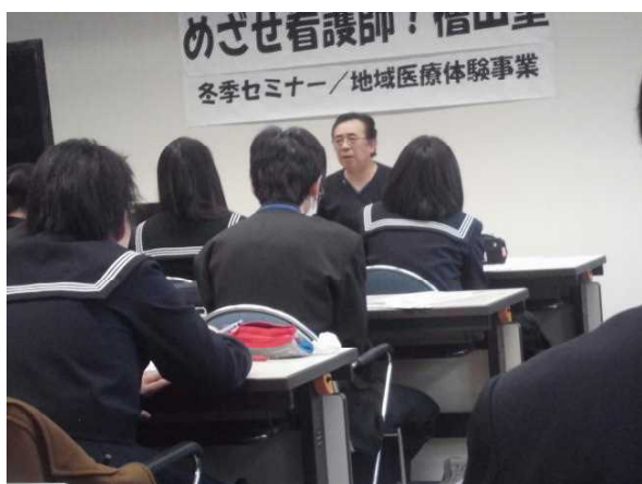
(「私の仕事紹介」⑤理学療法士)