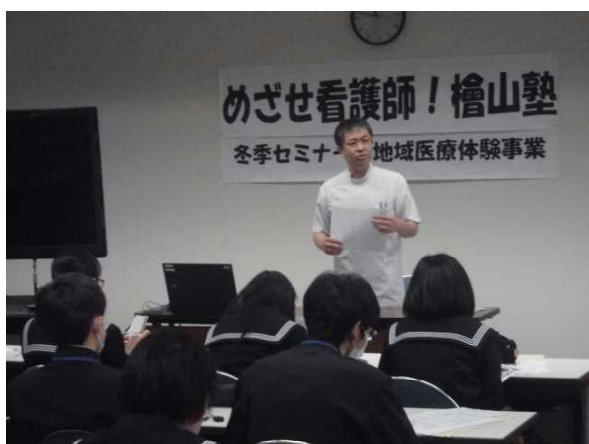
(「私の仕事紹介」⑤理学療法士)