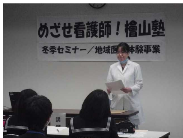
(「私の仕事紹介」⑥作業療法士)