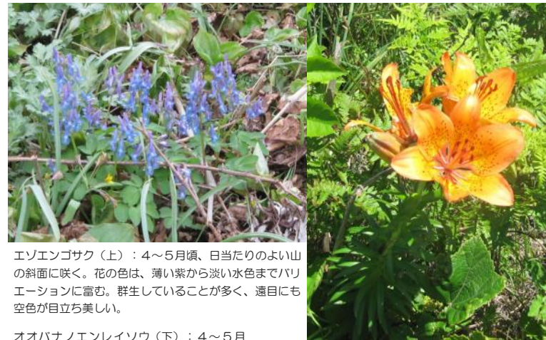
エソエンゴサク（上）：4～5月頃、日当たりのよい山の斜面に咲く。花の色は、薄い紫から淡い水色までバリエーションに富む。群生していることが多く、遠目にも空色が目立ち美しい。