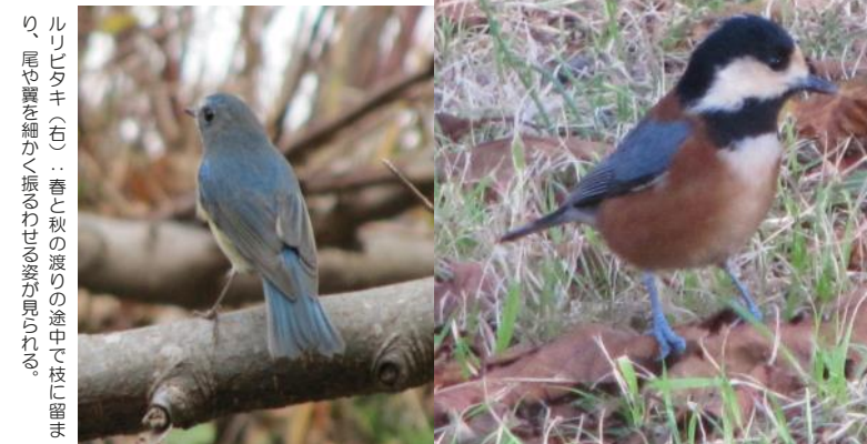
ルリシギ（上）：春と秋の渡りの途中で、枝に留まり、尾や翼を細かく振るわずに姿が見られる。