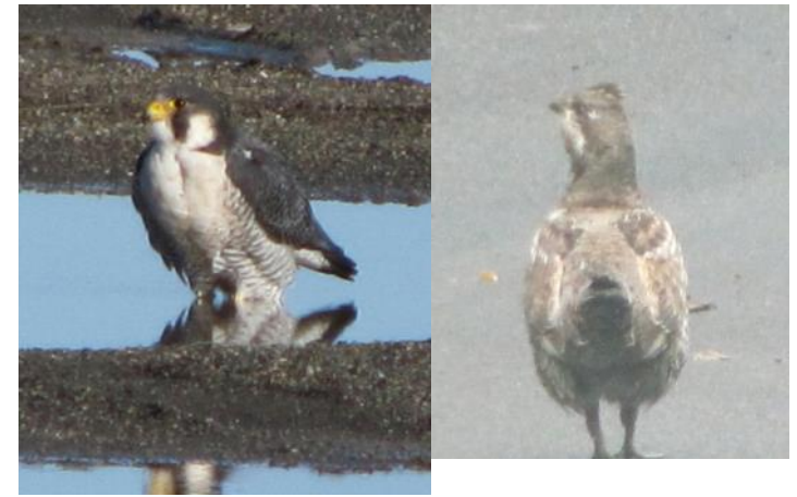
ハヤブサ（上）：海岸の崖の多い場所で繁殖し、崖のてっぺん等から、ハトなど中型の野鳥を見つけ襲う。春先に、オスがメスにエサを空中で受け渡すシーンがよく見られる。 ヤマガラ（下）：夏場は山中で繁殖し、秋から冬にかけ町中でも見られる。枝に逆さまに止まり、虫や木の実をついばむなど、アクロバティックな動きをする。