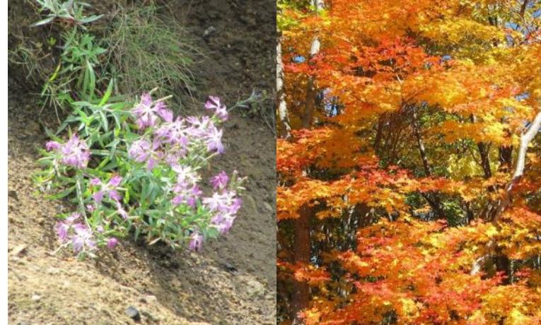
エソカワラナデシコ（上）：7～9月頃、海岸の岩場や河原などに咲く。一つの茎に数個の花を付け、ピンク色がよく目立つ。葉や茎も薄い水色のよう独特の色合いで他の植物と区別しやすい。