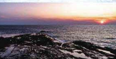
江差町 / かもめ島千畳敷