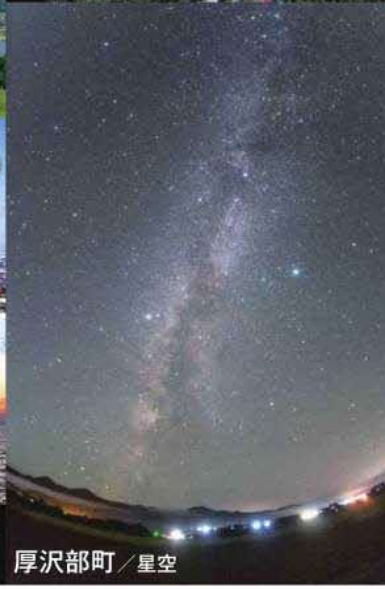
厚沢部町 / 星空