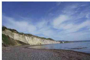
白い断崖がつづく「シラフラ」