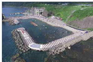
元和台海滨公園「海のプール」