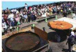
あっさひメークインで巨大コロック製作