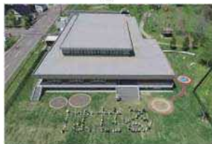
厚沢部町認定こども園はせる

あっさひメークイン、米（はっくらにんご） グリーンアスパラ、メロン、カボチャ、黒豆 舞茸、焼酎「喜多里」（さつま芋・メークイン等）