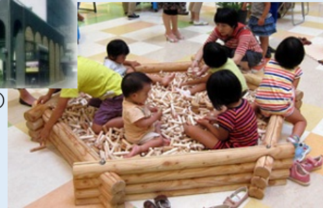
(木育遊具：きぼうのプール)