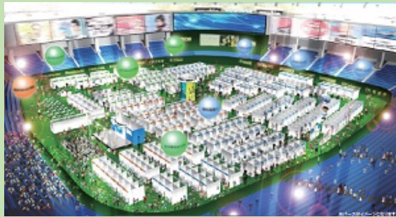
(地域発見フェアイメージ)