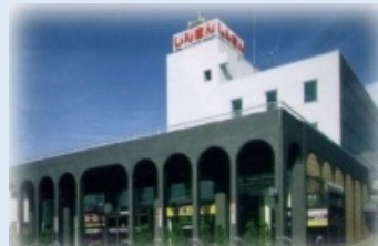
(江差信用金庫本店)