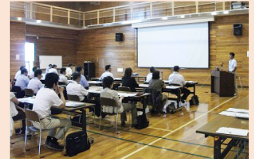
(相互研修会のイメージ)