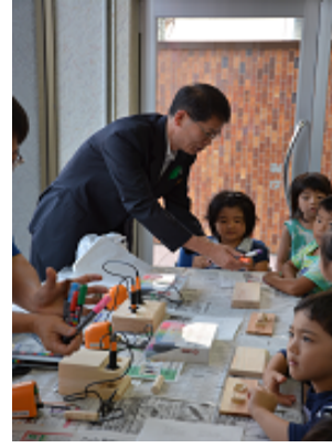
【9/3あすなろ幼稚園児来店】