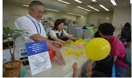
【9/3あすなろ幼稚園児来店】