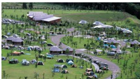
鶉ダムオートキャンプ場

地元産農産物の直売が人気の道の駅「あっさぶ」は令和4年度に新商業施設が完成し、買い物だけではなく飲食も楽しめる場所です。