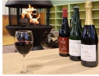
上ノ国ワイン (上の赤・上の白 ナイアガラ・上の泡)