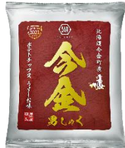
写真左：今金男しゃく 右：ポテトチップス今金男しゃく