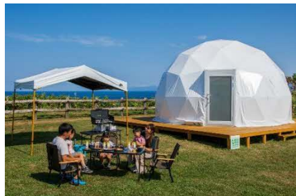
かもめ島上でのグランピング