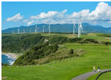
パノラマラインと風車

水質良好な3カ所の海水浴場、北檜山・臼別・貝取潤などの温泉、北海道最古の山岳霊場「太田神社」など、観光資源にも恵まれています。