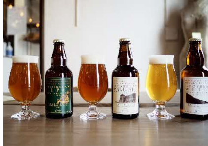
地域資源を活用したクラフトビール