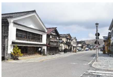
ニシン漁繁栄時の町並みを再現した「いにしえ街道」

町には、かつてニシン漁による繁栄で築かれた歴史・文化が色濃く根付いており、そのストーリーが日本遺産に認定されているほか、「江差追分」は多くの愛好者に唄い継がれています。