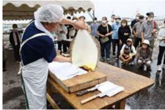
「てっくい海鮮まつり」

さらに、18歳以下の子ども医療費・保育料・小中学校の給食費などの無料化や、子どもが新しく生まれた世帯への出生祝金、出産・子育て応援ギフトの給付など、子育て世代を手厚く支援しています。