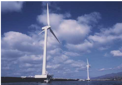
日本初の洋上風車「風海鳥」